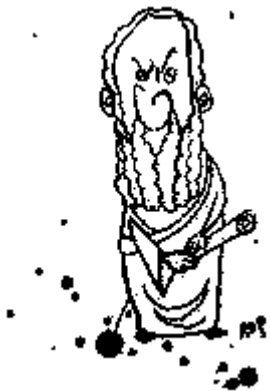
Caricatura de Heródoto publicada en el Diario Página 12 .