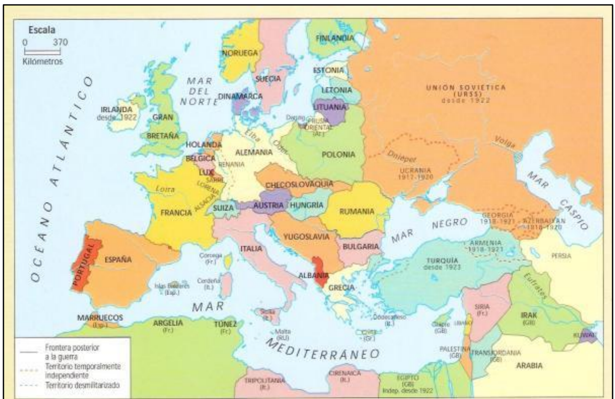
Europa luego de la Primera Guerra Mundial