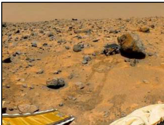
La Mars Pathfinder domina el paisaje rocoso de Marte en esta imagen tomada durante tres días en 1997. A lo lejos se ven las colinas del planeta rojo.

Marte es un cuerpo rocoso pequeño que fue considerado similar a la Tierra en algún tiempo. Del mismo modo que los demás planetas terrestres (Mercurio, Venus y la Tierra), su superficie fue variando debido a la actividad volcánica, los impactos de otros cuerpos, movimientos de su corteza y efectos atmosféricos como las tormentas de arena. Tiene casquetes polares que crecen y decrecen cuando cambian las estaciones; algunas zonas de suelo estratificado cerca de los polos de Marte sugieren que el clima se modificó más de una vez, quizás debido a un cambio regular en la órbita del planeta.